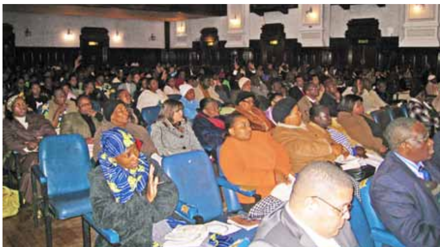
Shromáždění v Johannesburgu 17. srpna 2009.

Svobodná lidová misie informační kancelář Doubecká 556 Jahodnice Praha 9 - Kyje CZ-198 00 tel. 281 931 729 e-mail: svobodna.lidova@post.cz